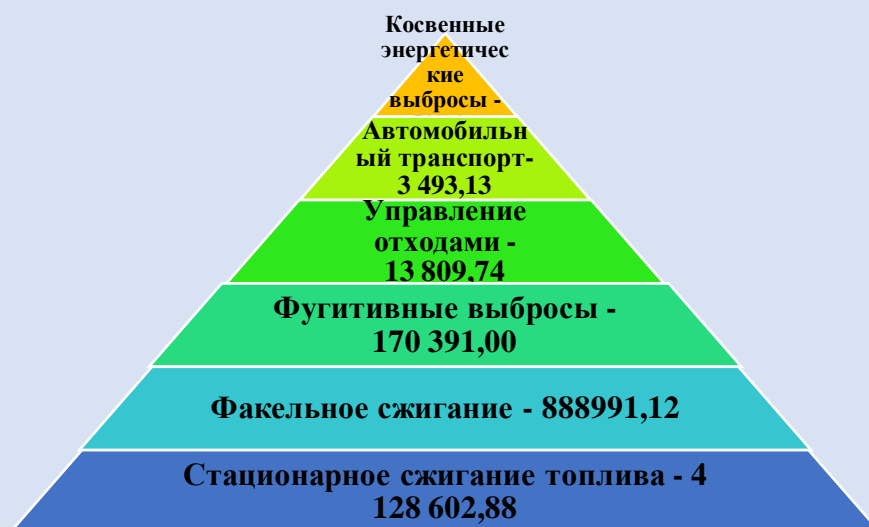
Рисунок 1. Распределение выбросов парниковых газов ОАО «Ямал СПГ» в 2021 году по видам источников, тCO 2 -экв

Косвенные энергетические выбросы ПГ за отчетный период составляют 0,01 % от суммарных выбросов ПГ.