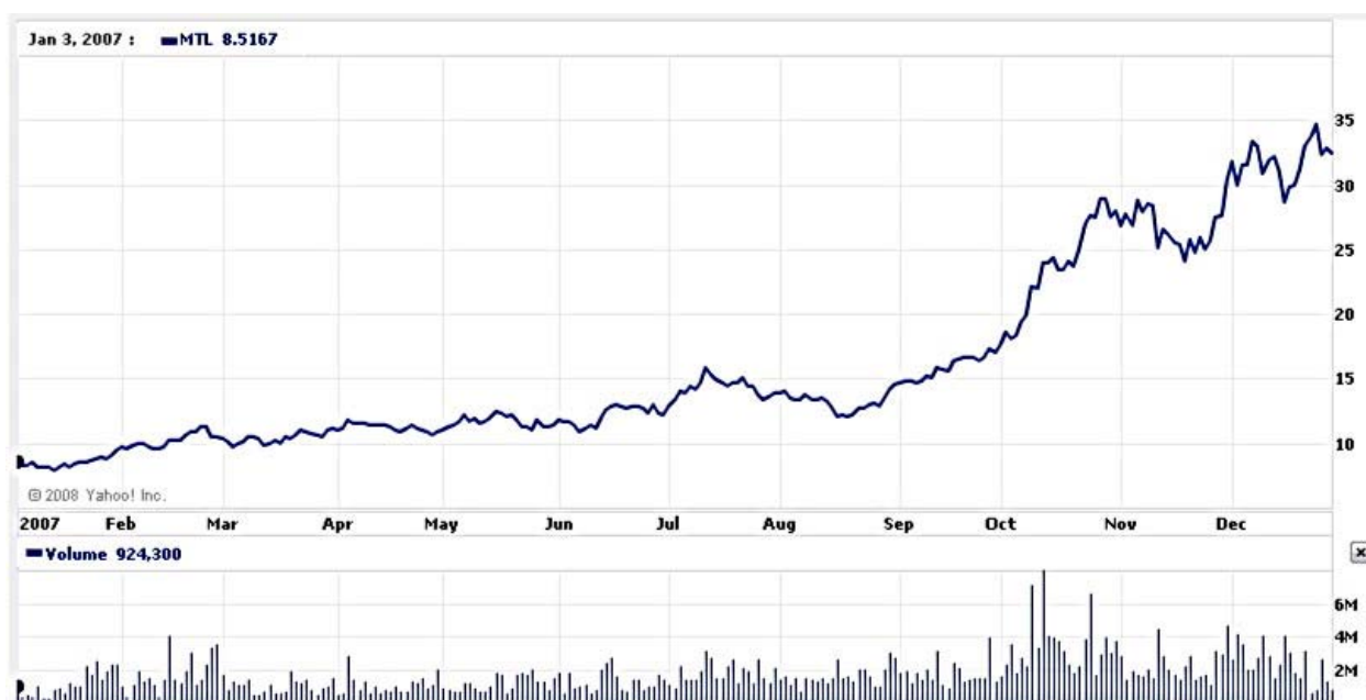
Динамика цен одной американской депозитарной расписки за 2007 г.

Обыкновенные именные акции ОАО «Мечел» обращаются за пределами Российской Федерации в форме американских депозитарных расписок 3 уровня (далее – АДР) на Нью-йоркской фондовой бирже. Каждая АДР представляет три обыкновенные акции ОАО «Мечел».