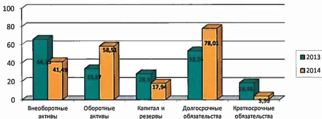
Рис.1 Изменение структуры баланса за 2013-2014 гг., %