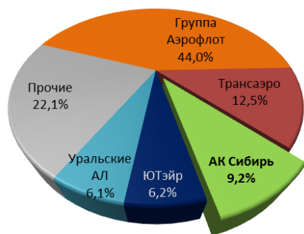
Структура рынка по итогам 2015 г. (Топ 5)