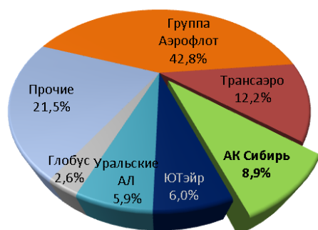
Структура рынка по итогам 2015г. (Топ 6)