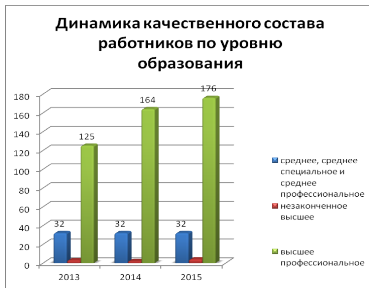
Рис.5 Динамика качественного состава работников за 2013-2015 г.г.

Структура работающих сотрудников Общества по уровню образования остается неизменно высокой на протяжении ряда лет, что обусловлено производственной необходимостью и высокими требованиями к квалификации персонала в электроэнергетической отрасли.