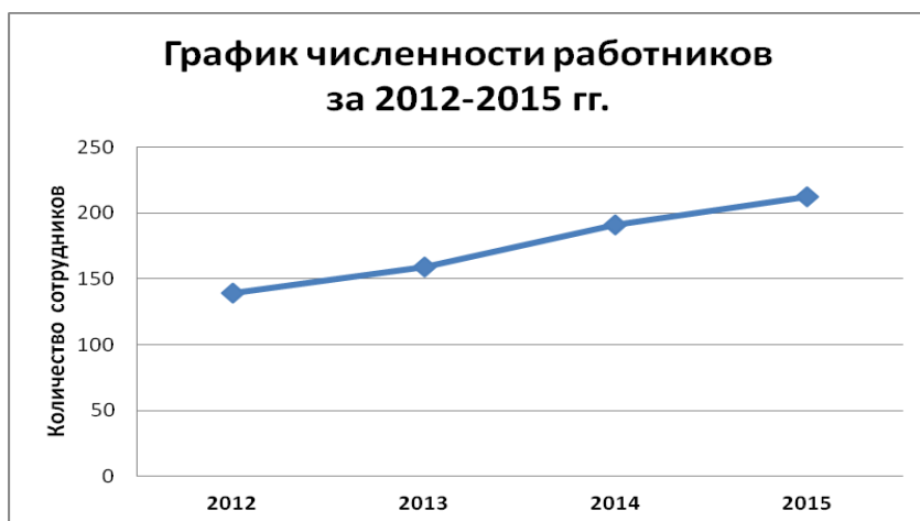
График численности работников за 2012 – 2015 гг.

Применение ротации является положительным фактором, благотворно влияющим на конечный результат деятельности Общества.