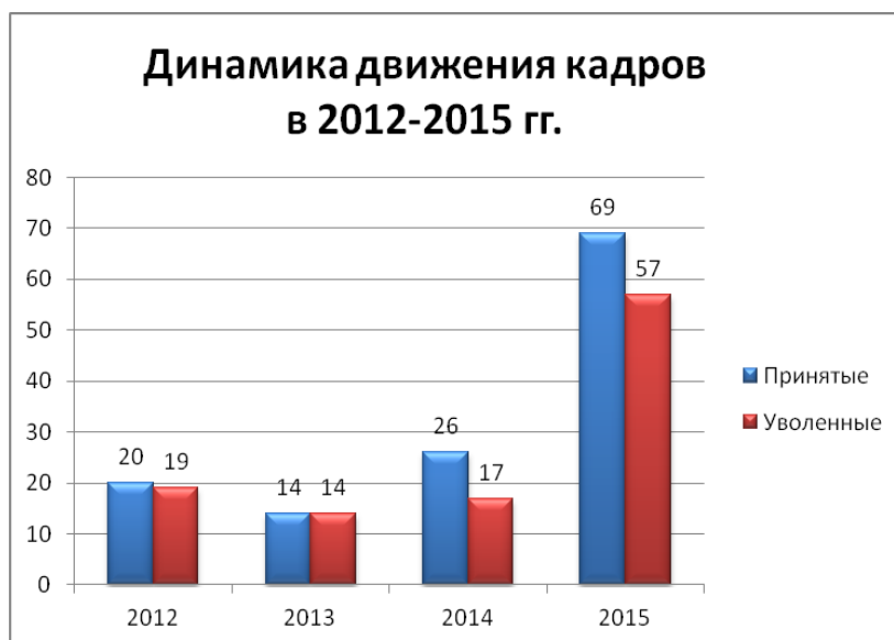
Рис.1 Динамика движения кадров в 2012-2015 г.г.

Увеличение текучести кадров в 2015 году вызвано проводимой кадровой политикой по оптимизации численности и штата Общества.