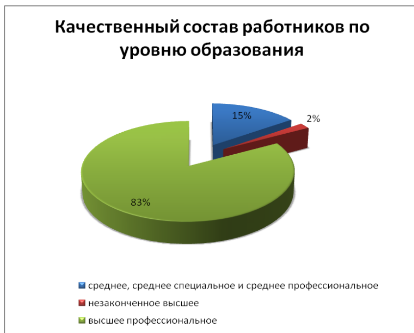
Рис.4 Качественный состав работников по уровню образования

Именно эта информация призвана послужить отправной точкой для создания отличительного преимущества компании ПАО ГК «ТНС энерго».